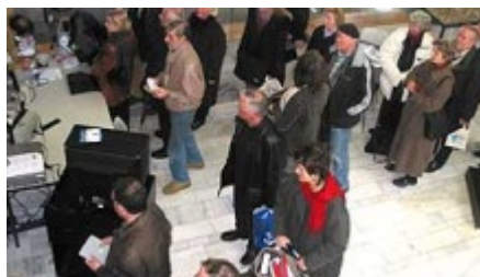
Viele Menschen brachten ihre alten Filme vorbei

Dem gemeinsamen Aufruf: "Liebe Zuschauer werfen Sie die Rollen nicht weg, kommen Sie zu uns und bringen Sie uns Ihr historisches Material" folgten damals mehrere Hundert Menschen. Der Historiker Diethelm Knauf vom Landesfilmarchiv sichtete unendlich viele Filme, ordnete die Bilder in ihrer Bedeutung ein und übernahm sie - das Einverständnis der Eigentümer vorausgesetzt - in seinen Bestand. Im Landesfilmarchiv werden sie nun fachgerecht gelagert.