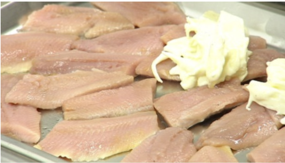
So sehen die Matjes mit Hausmacher-Dressing aus.