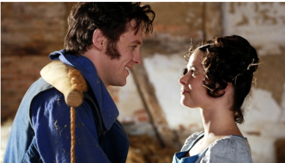
Lissi liebt den Johann und Johann liebt die Lissi.

und witziger geworden und im Gegensatz zum Original kommen die Tiere sogar in Bremen an.