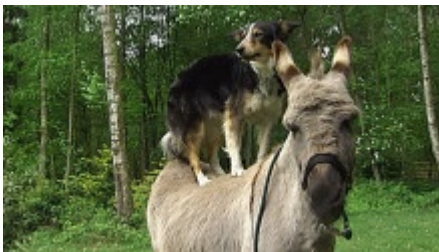
Die Tiere beim Training.