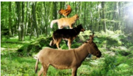
Die Stadtmusikanten als Tier-Pyramide.

Radio Bremen hat eine Neuauflage des Grimmschen Märchens produziert: "Die Bremer Stadtmusikanten" wurden im Sommer 2009 in Bremen und Umgebung gedreht, unter anderem auf dem historischen Marktplatz der Hansestadt, im Urwald Hasbruch bei Delmenhorst und dem Findelhof bei Celle.