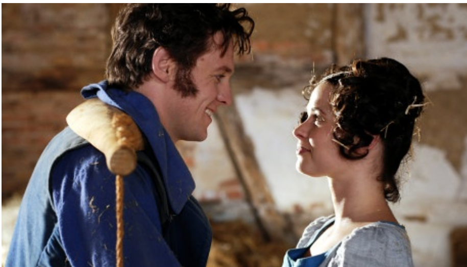
Lissi liebt den Johann und Johann liebt die Lissi.

und witziger geworden und im Gegensatz zum Original kommen die Tiere sogar in Bremen an.