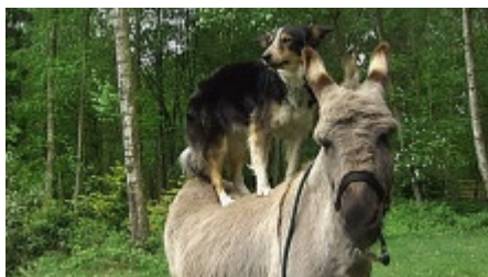
Die Tiere beim Training.