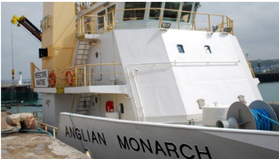
Der Seenotrettungsschlepper Anglian Monarch unter französisch-britischem Befehl sorgt im Ernstfall dafür, dass havarierte Schiffe schnell von den Seefahrtsstraßen geschleppt werden.

Jederzeit kann es in diesem Gebiet zu einer Katastrophe kommen. Denn es gilt als eines der gefährlichsten Nadelöhre des weltweiten Seeverkehrs. Täglich fahren hier 500 Schiffe durch, darunter Passagierschiffe, Erdöltanker, Kriegsschiffe und mit gefährlichen Chemikalien beladene Containerschiffe. Dazu kommen noch unzählige Fischerboote und Freizeitsegler.