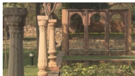
Garten in Dehli

Auf den ersten Blick sind das keine idealen Bedingungen für Gärten und doch gibt es sie: Delhi ist eine der grünsten Städte der Welt mit öffentlichen und privaten Gärten, die für das europäische Auge ungewohnt sind. Eingewachsen in die Stadt liegen tausende von Denkmäler, vor allem Grabmäler, der letzten Jahrhunderte.