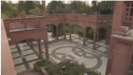
Der rote Sandstein ist charakteristisch für die indische Bauweise.