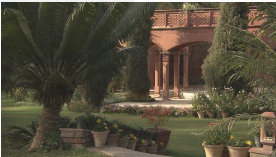
Die Gärten in Delhi sind meistens mit hunderten von Töpfen bestückt.

Alle diese Gärten sind auf immensen Flächen angelegt, der größte im Film vorgestellte umfasst 30.000 Quadratmeter. In diesen Dimensionen gibt es keine Blumen-Beete, sondern Blumen-Felder. Anders als bei uns sind die Gärten in Delhi zudem bestückt mit hunderten von Töpfen, was einen großen Arbeitsaufwand bedeutet, der aber in Indien willkommen ist: Je mehr Aufwand, desto mehr Arbeitsplätze. Die Gartenbesitzer profitieren auch davon: mit einer Blütenfülle, die alle zwei bis drei Wochen durch neue Blumentöpfe gewährleistet ist.