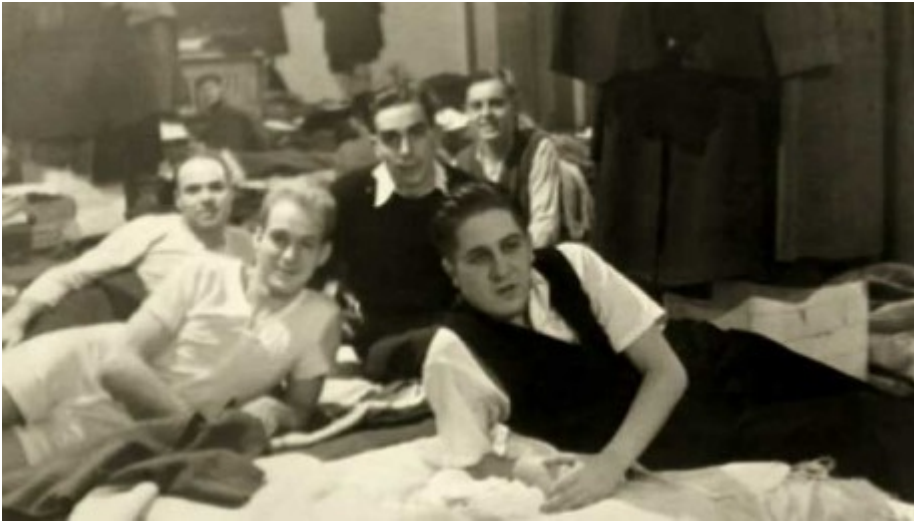
Die Internierten im Lager

Nach ihrer Rückkehr 1945 nach Deutschland werden sie als Kriegsgefangene behandelt und kommen in die berüchtigte Festung Hohenasperg bei Stuttgart. Erst 1946 ist für die meisten Männer der "Columbus" die letzte Fahrt zu Ende.