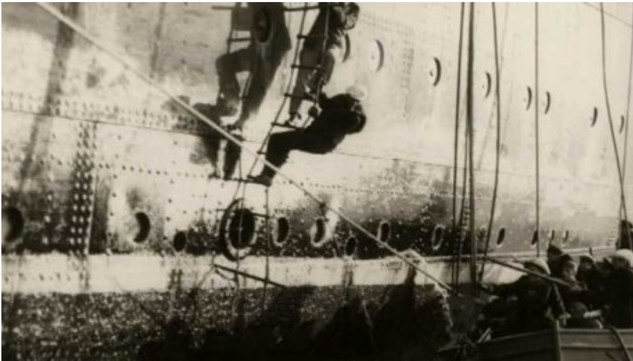
Die Mannschaft der "Columbus" bringt sich in Sicherheit

70 Jahre nach dem Untergang des Kreuzfahrtschiffes beleuchtet diese zweiteilige Dokumentation die Hintergründe der spektakulären Selbstversenkung der "Columbus" und die Odyssee der deutschen Besatzung in den USA bis zu ihrer Heimkehr Ende 1945. Grundlage der Dokumentation bilden die einzigartigen 16-mm-Filmaufnahmen und die zahlreichen Fotografien des Bordfotografen Richard Fleischhut, die von der "Columbus" erhalten geblieben sind.