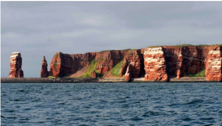
Etwa 60 Meter ragt die Insel aus rotem Buntsandstein aus dem Meer heraus. Die „Lange Anna“, ein freistehender Fels, ist das Wahrzeichen von Helgoland.

Nirgendwo sonst an der deutschen Küste ist man so sehr mitten in der Nordsee wie auf Helgoland. Die kleine Insel aus rotem Buntsandstein liegt etwa 70 Kilometer vom Festland entfernt und ist nur rund einen Quadratkilometer groß.