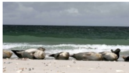
Seehunde und Kegelrobben ruhen sich auf den Sandbänken der "Düne" von der Jagd im Wasser aus.

Er begleitet den einzigen Hauptkommissar der Insel auf seinen Streifzügen, besucht die Bunkeranlagen aus dem Zweiten Weltkrieg und entdeckt gemeinsam mit einem Hobbygeologen die seltenen Roten Feuersteine.