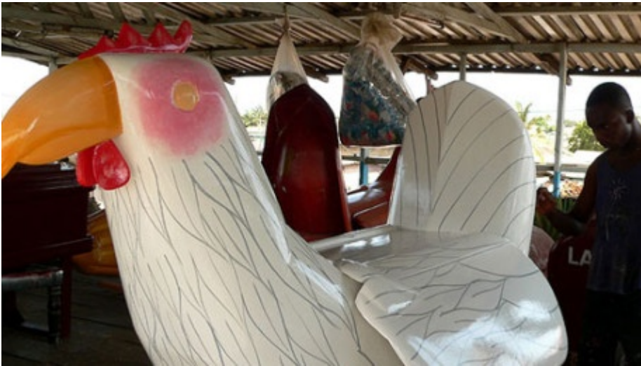
Sarg in Huhn-Form

Was haben ein Mercedes Benz, ein Huhn und ein Fisch gemeinsam? Im westafrikanischen Ghana kann man sie als detailgetreu nachgebaute Särge kaufen. Sie begleiten die Toten auf ihrer Reise ins Jenseits. In der Vorstellung der Ghanaer begeben sich die Verstorbenen auf eine Reise zu den Ahnen, zu denen, die bereits vor ihnen gegangen sind. Dafür werden aufwändige Bestattungsrituale durchgeführt, die Toten erhalten die Feier ihres Lebens.