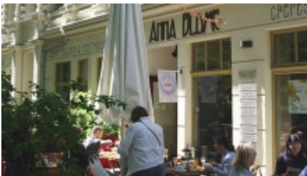
Schöne Altbauten und im Café sitzen, der Prenzlauer Berg hat mediterranes Flair

Die Schickeria im ehemaligen Arbeiterviertel