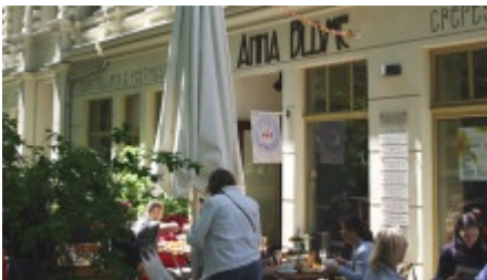
Schöne Altbauten und im Café sitzen, der Prenzlauer Berg hat mediterranes Flair

Die Schickeria im ehemaligen Arbeiterviertel