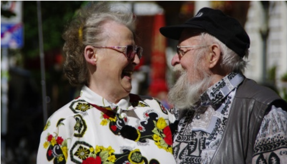
Das Ehepaar Kauz lebt seit über 50 Jahren am Kollwitzplatz. Sie sind "die letzten Mohikaner" ihrer Generation.