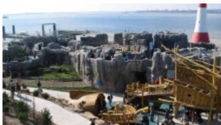
Der Bremerhavener Zoo liegt direkt am Wasser.

Der 1928 gegründete Zoo am Meer in Bremerhaven, ist einer der modernsten Zoos in Europa. Im kleinen aber feinen Themenzoo können Nordische und Wasserbezogene Tiere mit Blick auf das Meer erlebt werden. Die Einbeziehung der natürlichen Meereskulisse in die Gehegegestaltung vermittelt durch die großzügig gestalteten, naturnahen Biotopanlagen einen Eindruck von der Weite im Lebensraum von Eisbär, Robbe, Pinguin und Co.