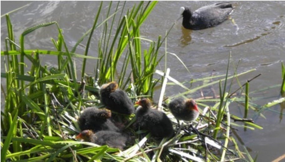
Blesshuhn-Nachwuchs! Frauke Stepputat gelang diese Aufnahme am Werdersee in Bremen.