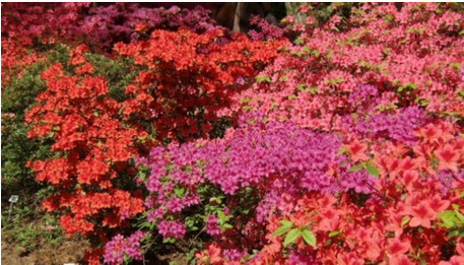
Michael Kittler aus Bremen-Findorff brachte uns dieses Foto von einem Gang durch den Rhododendronpark mit. Wie man sieht, lohnt sich der Besuch zurzeit.