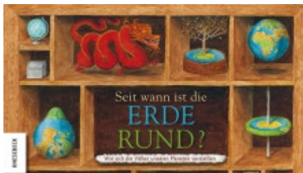
Guillaume Duprat: "Seit wann ist die Erde rund?", Knesebeck, 2009

Heute weiß jedes Kind, dass die Erde rund ist. Aber wie haben sich früher die Menschen unseren Planeten vorgestellt? Die Eskimos dachten, die Erde ist eine Insel aus Eis, die auf dem Meer schwimmt. Für die Azteken war sie ein riesiges Kreuz. Die Chinesen wiederum glaubten, in einer Welt zu leben, die die Form einer umgedrehten Teeschale hat. Die Menschen in Griechenland waren vor 1500 Jahren davon überzeugt, dass wir in einer Truhe leben, von deren Deckel die Sterne wie Lampen herabhängen.