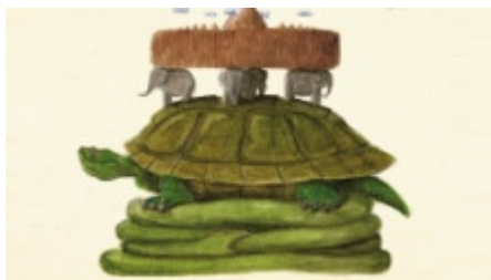
Diese Vorstellung von der Erde entstand vor 2500 Jahren im indischen Hinduismus.

Christoph Columbus glaubte, dass die Erde die Form einer Birne habe.