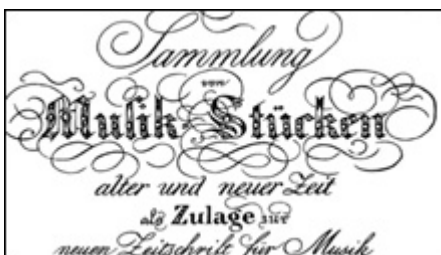
Umschlagseite eines Heftes der "Sammlung". 16 Hefte mit insgesamt 70 Kompositionen wurden von 1838 - 1841 veröffentlicht.

Zum 200. Geburtstag von Robert Schumann im Jahr 2010 realisiert Radio Bremen in Zusammenarbeit mit der Universität Bremen ein musikalisches und musikwissenschaftliches Großprojekt. In 16 über das Schumann-Jahr verteilten Sendungen im Nordwestradio wird Radio Bremen mit der Uraufführung der "Sammlung von Musik-Stücken alter und neuer Zeit" aufwarten.