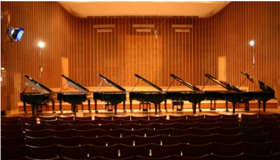
Zwei renommierte Pianisten präsentieren mit verschiedenen Gesangssolisten Highlights aus Schumanns Sammlung im Sendesaal Bremen.