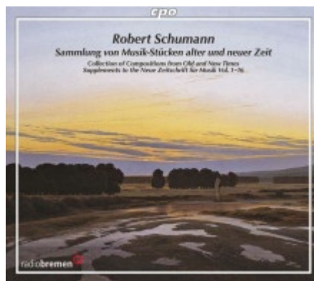
Robert Schumann: sammlung von Musikstücken alter und neuer Zeit, CPO

Alle Hefte dieser Sammlung werden ab dem 24. Januar 2010 im Abstand von drei Wochen im Sonntagskonzert des Nordwestradios zu hören sein. Präsentiert werden sie von dem bekannten Musikwissenschaftler und