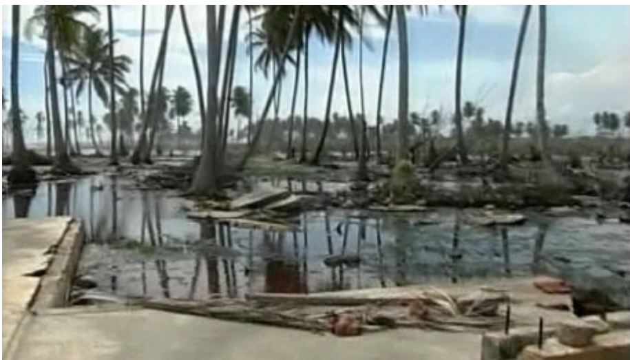
Verwüstete Landschaft nach dem Tsunami 2004