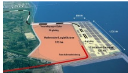
Fotomontage mit den genauen Ausmaßen des Hafens mit Bahn- und Straßenanbindung

Eines der grossen Prestigeobjekte im Norden ist der Bau des Tiefwasserhafens in Wilhelmshaven. Als einziger seiner Art in Deutschland wurde er entworfen, um auch Containerschiffen mit Übergroße Anlegemöglichkeiten zu bieten. In zwei Jahren soll der Jade-Weser-Port eröffnet werden. Auf eine Milliarde Euro werden inzwischen die Kosten veranschlagt und rund 2000 Arbeitsplätze sollen mit dem Bau geschaffen werden. Jutta Przygoda hat sich auf der Baustelle umgesehen und herausgefunden, daß auch am zukunftssträchtigen Tiefwasserhafen die Krise nicht spurlos vorbeigegangen ist.