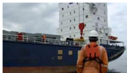
Die "Beluga Recognition" im Golf von Aden

"Kaperung eines Frachters, Angriff auf Passagierschiff, Überfall auf Segeljacht!" Beinahe täglich erreichen uns solche Nachrichten aus dem Golf von Aden. Die wichtigste Schifffahrtsroute zwischen Asien und Europa ist zum Operationsgebiet somalischer Piraten geworden, die mit ihren Kidnappings Millionen erpressen. Daran hat auch eine ständig wachsende internationale Militärmacht bisher nichts ändern können. Im Gegenteil rüsten die Piraten auf, verfügen über immer schnellere Boote und modernste High-Tech in der Ausübung ihres kriminellen Handwerks. Über mögliche Schutzmaßnahmen hat sich sich Radio-Bremen-Reporter Rainer Kahrs vor Ort informiert. Im Golf von Aden ging er an Bord des Schwergutfrachters "Beluga Recognition" und beobachtete wie sich die Besatzung vorbereitet auf den heiklen Wettlauf mit den Piraten vorbereitet an der derzeit gefährlichsten Wasserstrasse der Welt.