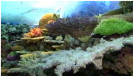
Schätze der Meere

Die Schätze der Meere finden sich heutzutage nicht mehr in Kisten und Schatullen, die Freibeuter auf dem Grund versenkt haben, vielmehr liegen sie unter dem Meeresboden in Form von Öl, Gas und Rohstoffen. Der ständig steigende Weltbedarf an Bodenschätzen hat neue Begehrlichkeiten geweckt, vor allem nachdem man vor gut dreißig Jahren das Phänomen der so genannten "Black Smoker", der "Schwarzen Raucher" entdeckt hat. "Schwarze Raucher" sind Kamine auf dem Meeresgrund von ca. 30-40 cm Durchmesser, aus denen bis zu 400 Grad Celsius heisses