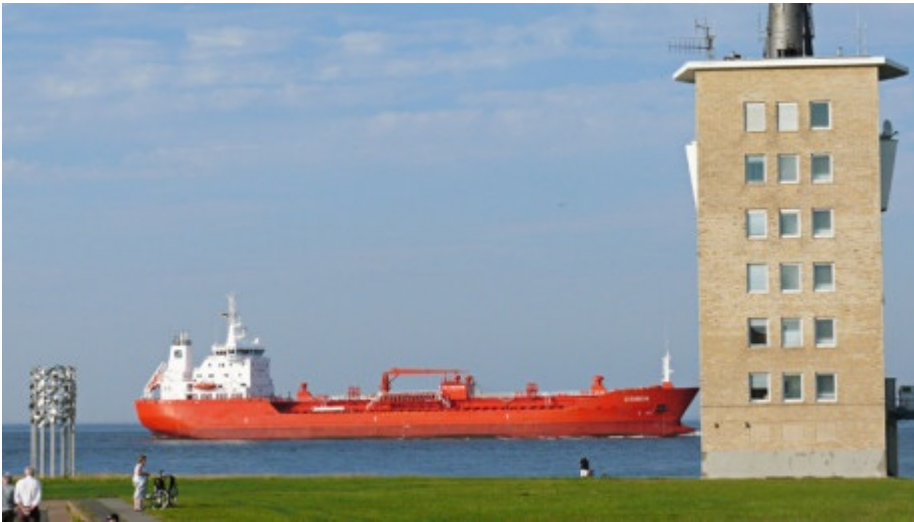
Wer wird Erster im Wettlauf?

Mare Radio stoppt die Zeit für die wahnwitzigsten Wettläufe zu Wasser und zu Lande. Welche Supermacht ist erste beim Rennen um die letzten Rohstoffvorkommen auf dem Meeresgrund und im ewigen Eis? Zwei Männer und ihre verrückte Wette: wer kommt am schnellsten einmal um den Globus, ohne das Flugzeug zu benutzen? Mare Radio nimmt's sportlich und verfolgt atemlos das Kräfteressen des Menschen mit Naturgewalten, begleitet spielerische Zweikämpfe ebenso wie Wettläufe um Leben und Tod.