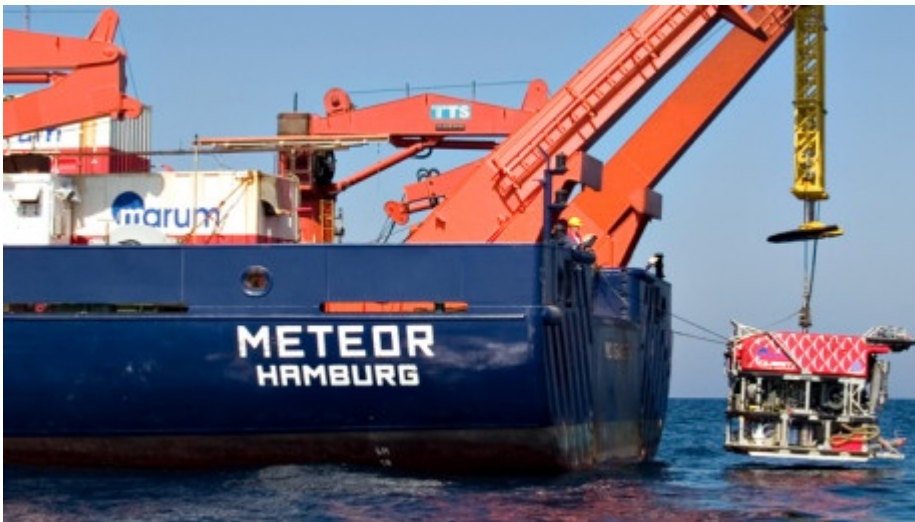
Forschungsschiff "Meteor" im Einsatz