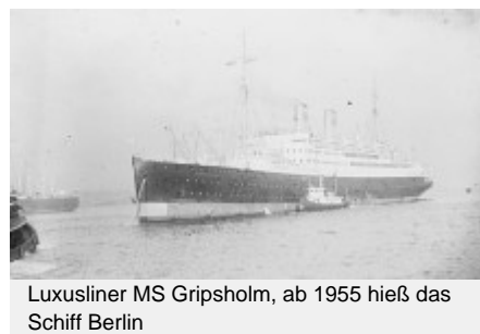
Luxusliner MS Gripsholm, ab 1955 hieß das Schiff Berlin