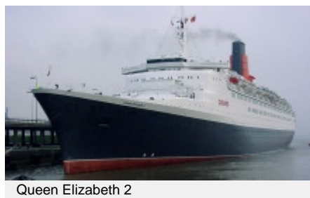
Queen Elizabeth 2