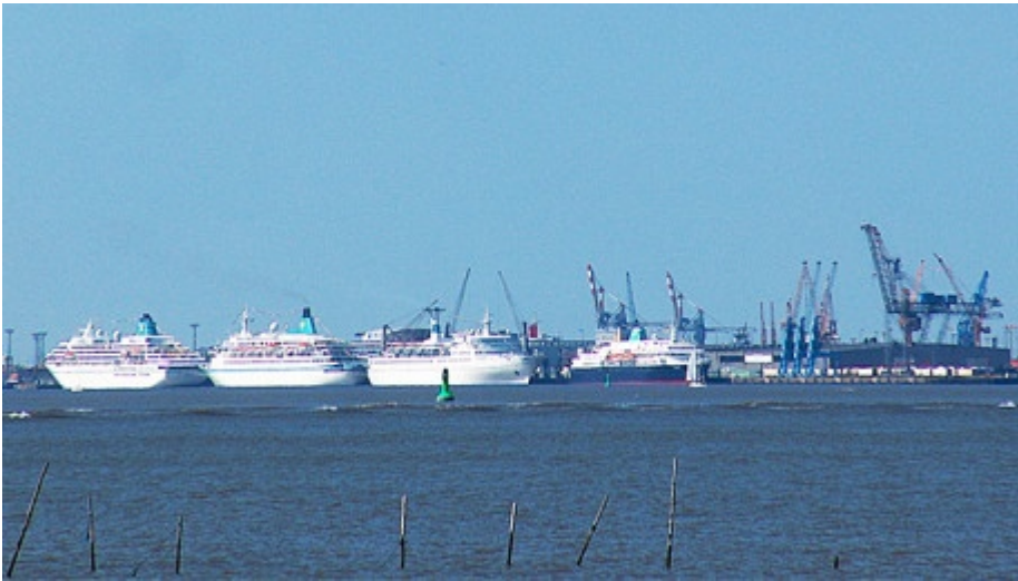
Traumschiffe vor dem Start