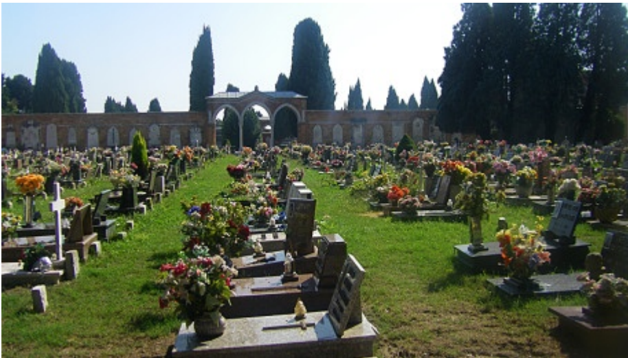
Friedhof San Michele in Venedig