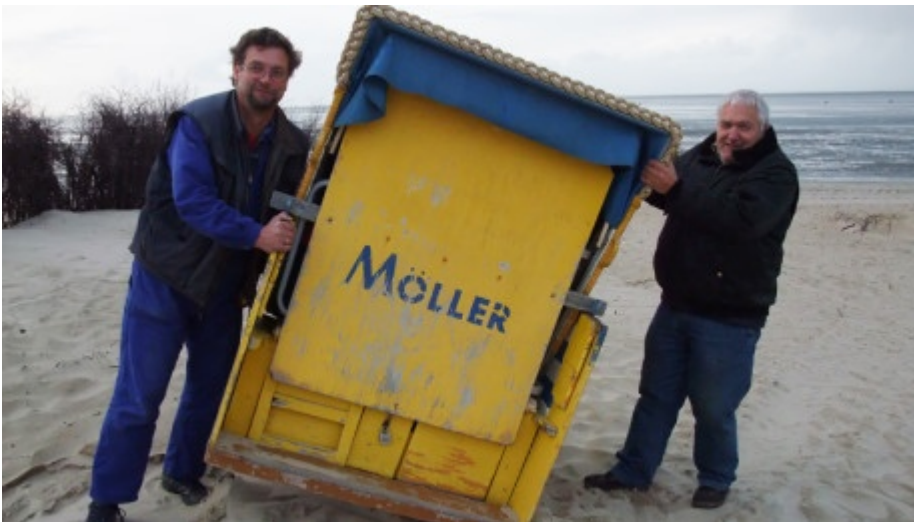
Strandkorbeinsammler in Cuxhaven