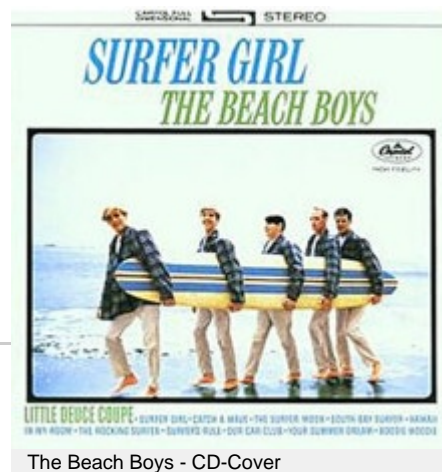
The Beach Boys - CD-Cover