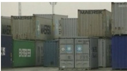
Alle Schiffscontainer in die USA sollen lückenlos auf potentielle Gefahren untersucht werden.