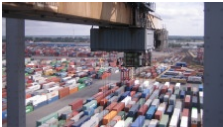
Containerhafen in Bremerhaven

Mare Radio stöbert in Kisten und Kasten, listet auf, was auf See so gebraucht wird und scheut sich nicht, Verborgenes ans Licht zu zerren. Und es wirft einen Blick auf die genormten, stapelbaren Blechboxen, die zu Tausenden auf den Meeren unterwegs sind. Wäre die Globalisierung ohne die Erfindung des Containers überhaupt möglich gewesen?