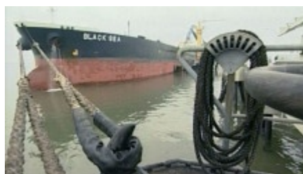
Erdöltanker im Hafen von Wilhelmshaven