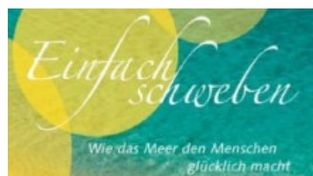
Eva Tenzer: Einfach schweben. Wie das Meer den Menschen glücklich macht, Mare-Buchverlag, Hamburg 2007