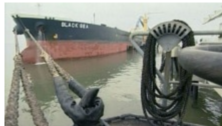
Erdöltanker im Hafen von Wilhelmshaven