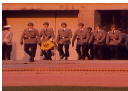
Störungsfreier Aufmarsch der Rekruten im Weser-Stadion.

Die Szenerie ist bizarr. Einheiten der Bundeswehr haben auf dem Rasen des Weser-Stadions Aufstellung genommen, um ein Gelöbnis zur Verteidigung des Vaterlandes abzulegen, Militärmusik schwappt durch das Stadion, auf den Rängen sitzen Soldaten, Offiziere, Politiker, Bundespräsident Karl Carstens spricht über Pflicht und Freiheit, alle suchen nach feierlicher Haltung, doch es hallen Pfeife und Gebrüll über das Tribünendach, es riecht nach brennenden Autos, ein knatternder Polizeihubschrauber kreiselt über allem.