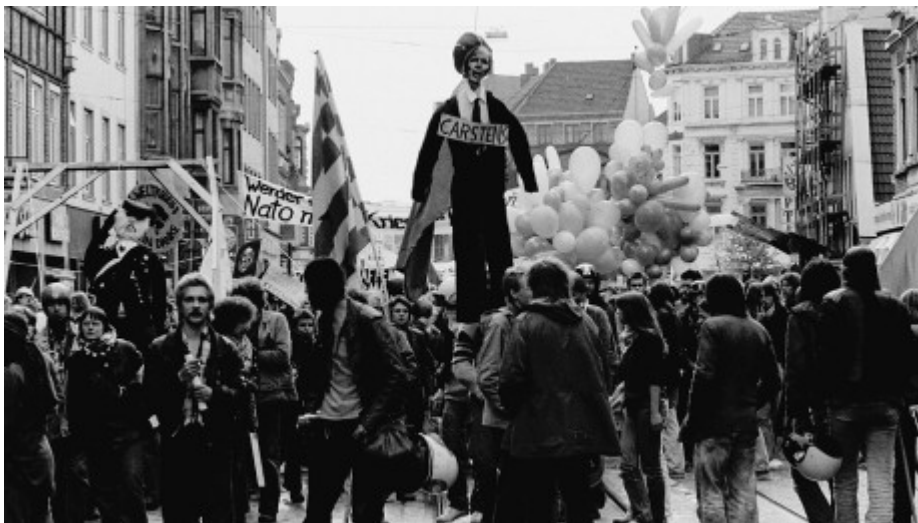
Eine Strohuppe, die starke Ähnlichkeit mit dem Bundespräsidenten Karl Carstens hat, führt den Demonstrationszug an.

1.200 Rekruten legen am 6. Mai 1980 in Bremen ihr feierliches Gelöbnis ab. Zudem wird ein Jubiläum gefeiert: Die Bundeswehr ist vor 25 Jahren der Nato beigetreten. Dazu ist politische Prominenz angereist, wie Bundespräsident Karl Carstens und Verteidigungsminister Hans Apel. Draußen vor dem Weser-Stadion marschieren 10.000 Demonstranten auf, um gegen die öffentliche "Militär-Show" zu protestieren. Aber der friedliche Protest eskaliert.