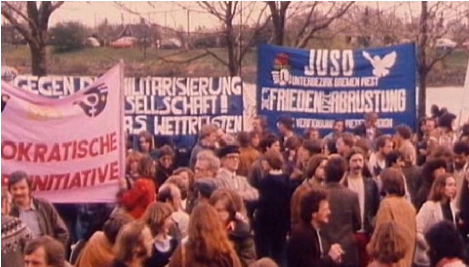
Demonstranten am Osterdeich

Dazu muss an die Situation im Frühjahr 1980 erinnert werden: Der NATO-Doppelbeschluss zur Nachrüstung und der Einmarsch der Sowjetunion in Afghanistan liegen gerade wenige Monate zurück, die Friedensbewegung in Deutschland war stark und genoss große Sympathien in der Bevölkerung.