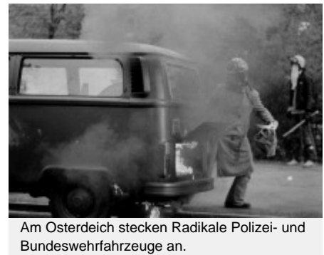
Am Osterdeich stecken Radikale Polizei- und Bundeswehrfahrzeuge an.

Dass solch ein Spektakel zu dieser Zeit einer Provokation gleichkommt und massiven Protest auslösen muss, liegt auf der Hand. Nur niemand, weder in der Politik, weder bei der Polizei oder beim Verfassungsschutz, aber auch nicht die Organisatoren der zwei angemeldeten Demonstrationen haben je mit einer solchen Eskalation der Gewalt gerechnet. Und sie nimmt an diesem Abend vor dem Weser-Stadion ihren Ausgang von einer relativ kleinen Gruppe militanter Autonomer bis hinein in das RAF-Sympathisantenumfeld. Die haben von vornherein auf gewaltsame Konfrontation gesetzt. Eine gemeinsame Demonstrationsleitung o.ä. gibt es seit dem Eintreffen am Weser-Stadion nicht mehr. In der Folge wächst die Aggressivität der Polizisten. Pflastersteine fliegen zurück, Wasserwerfer mit CS-Gas werden eingesetzt, nach Einbruch der Dunkelheit räumen einige Hundertschaften der Polizei dann massiv den Osterdeich und seine Seitenstraßen und prügeln wahllos auf jeden ein, der nicht schnell genug fliehen kann.