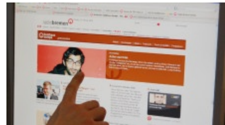
Auf allen Übersichtsseiten gibt es einen Top-Teaser, der über zwei Spalten hinweg dargestellt wird.

Die tagesaktuellen Informationen aus der Radio-Bremen-Nachrichtenredaktion finden sich auf allen Seiten künftig ganz oben, gefolgt von den Themen, die die aktuellen Hörfunk- und Fernsehsendungen begleiten. Wenn Sie ein Thema interessiert, dann sind weitere Informationen zur bevorstehenden Ausstrahlung oder direkt zum Beitrag bzw. zur Sendung ebenfalls direkt mit dem Text verbunden.