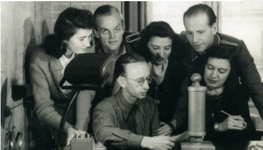
Inmitten seiner Redaktions-Kollegen bei "Radio Belgrad".