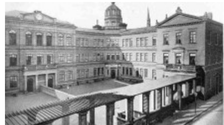
Schulgebäude des Alten Gymnasiums an der Dechanatstraße (1875 - 1987)