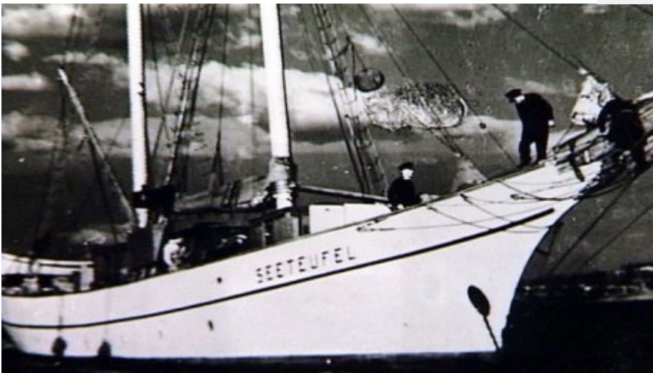
Mit der "Seeteufel" und Graf Luckner auf Weltreise