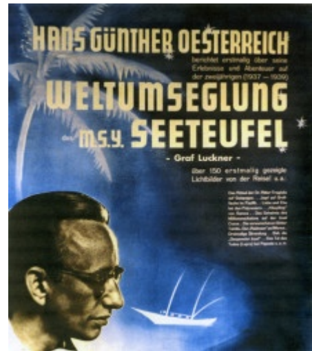
Werbeplakat für Reiseberichterstattung