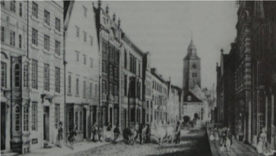
In der Oberstraße wohnte Gesche für kurze Zeit zwischen 1823 und 1825.

ihren Namen und heißt fortan Gesche Gottfried. Niemand in Bremen ahnt, dass sie zu dem Zeitpunkt bereits die ersten Morde begangen hat: Sie mischte Arsen ins Essen und vergiftete ihre Opfer .