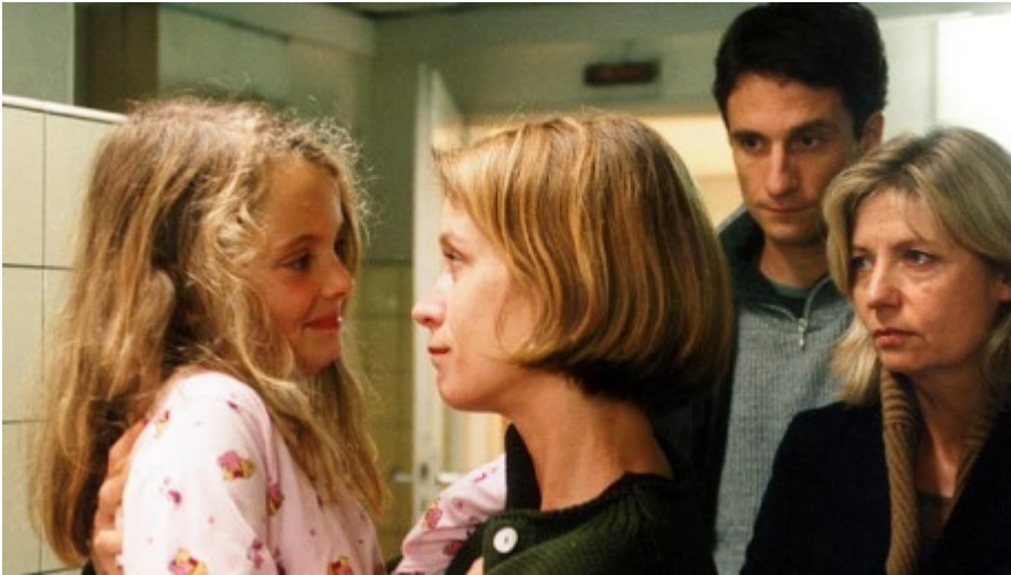
Die moderne Tatort-Gesche: Die psychisch kranke Mutter erklärt ihrer Tochter den Tod. Rechts: die Kommissare Lürsen und Stedefreund.