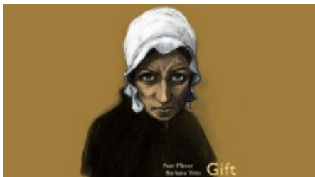
Graphic Novel "Gift" von Peer Meter & Barbara Yelin

"Das Gift erschleicht im Dunkeln Geld und Macht, ich hab es zum Genossen mir erdacht..."