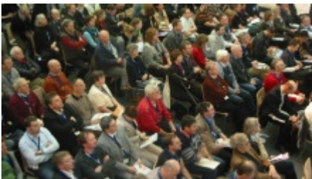
Volles Haus beim Extremwetterkongress in Bremerhaven

Die Liste der Möglichkeiten sei lang: angefangen von einer Förderung des öffentlichen Personennahverkehrs über elektrisch betriebene Autos bis hin zur besseren Nutzung von Strom und Wärme. Es könnten Pilotregionen entstehen, die bei dieser Entwicklung voran gingen, meint Kemfert. Gleichzeitig müssten sich die Städte stärker an die Wetterextreme anpassen: