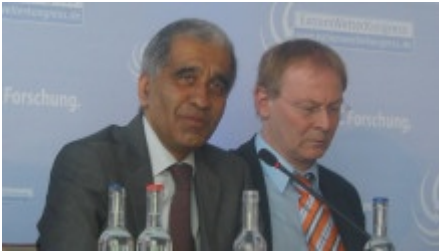
Über den Stand der Forschung zu El Nino referiert Prof. Dr. Mojib Latif.

dass die Wissenschaft ihre Ergebnisse noch klarer und transparenter deutlich mache und sie mit Skeptikern noch intensiver diskutiere, sagte Mojib Latif vom Leibnitz-Institut für Klimaforschung. Beim Extremwetterkongress stellen Experten auch neue, exaktere Systeme für Wettervorhersagen vor. Noch bis Samstag diskutieren 800 Teilnehmer in Bremerhaven über mögliche Folgen des Klimawandels.