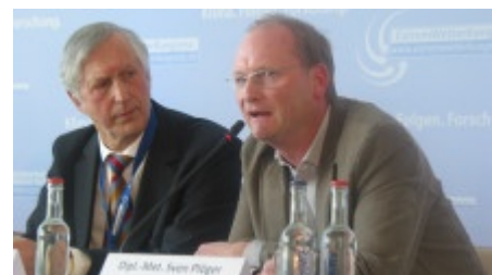
Er ist aus dem Fernsehen bekannt: Dipl.-Meteorologe Sven Plöger.

Dass es in den großen Städten künftig in den Sommermonaten heißer wird, daran haben die Experten auf dem Bremerhavener Extremwetterkongreß keine Zweifel. Deshalb müssten auch die Stadtplaner umdenken und unter anderem Schneisen schaffen für bessere Luft in den Ballungszentren. Wie sich bauliche Veränderungen in den Städten auf die Luftströme dort auswirken, das können Meteorologen heute bereits simulieren. Speziell entwickelte Vorhersagemodelle machen das möglich. Ebenso lässt sich die Wahrscheinlichkeit, ob Hitze oder Starkregen eine Stadt treffen, inzwischen genauer bestimmen. All das helfe den Städten, sich auf extreme Wetterereignisse einzustellen.