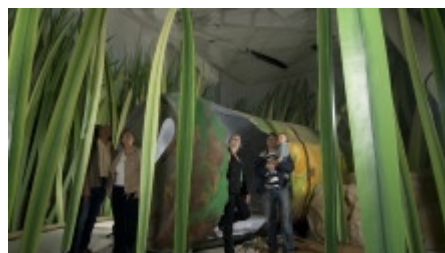
Wissensvermittlung wird zum Event - Die Welt aus der Insektenperspektive

Das Klimahaus Bremerhaven hat sich ein ehrgeiziges Ziel gesetzt: Es will informieren und unterhalten zugleich. Die komplexen Zusammenhänge im Klimageschehen werden nicht bloß auf spröden Info-Tafeln erläutert, sondern durch interaktive Exponate erfahrbar gemacht. Der Besucher soll zum Forscher werden: Mit Zutaten wie Feuer, Erde, Wasser und Luft kann er Stürme oder einen Vulkanausbruch verursachen. In der Themenkammer kann er herausfinden, wie sich im Alltag der persönliche CO2-Ausstoß verringern lässt.