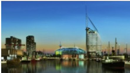
Alter und Neuer Hafen

Das Klimahaus ist ein Baustein der so genannten "Havenwelten". Damit wird ein Teil Bremerhavens auf dem Gebiet des Alten und Neuen Hafens bezeichnet, der derzeit vollständig umgestaltet wird. Durch die umfassenden baulichen Veränderungen will Bremerhaven Touristen in die Stadt locken. Neben dem Klimahaus gehören das Atlantic-Hotel "Sail-City" mit seiner Aussichtsplattform, das Einkaufszentrum "Mediterraneo", das "Deutsche Auswandererhaus", das "Deutsche Schifffahrtsmuseum" und der "Zoo am Meer" zu den "Havenwelten". An dem Ausbau sind private und öffentliche Geldgeber beteiligt. Die staatlichen Zuschüsse betragen mehrere hundert