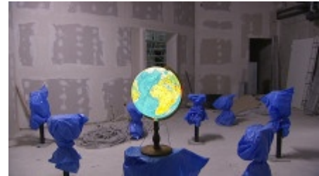
Baustelle Klimahaus Bremerhaven

Radio Bremen testet: Wie klimafreundlich ist das Klimahaus? ➔