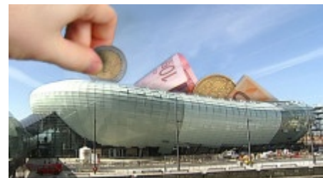
Das Klimahaus wurde 50 Millionen Euro teuer als ursprünglich geplant

Die Verzögerungen führten auch zu einer Kostenexplosion. Im welchem Umfang ist zur Eröffnung des Klimahauses noch nicht genau bekannt. Zwischen 20 und 50 Millionen Euro soll der Bau zusätzlich gekostet haben. Ursprünglich waren rund 70 Millionen Euro veranschlagt. Bauherrin des Klimahauses ist die BEAN, eine Tochtergesellschaft der Stadt Bremerhaven, für die die Kommune nun neue Schulden machen muss, damit die letzten Arbeiten überhaupt bezahlt werden können.