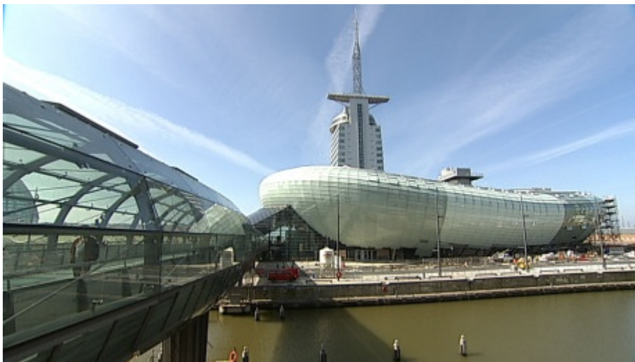
Das Klimahaus Bremerhaven

Einmal die Welt umrunden, durch Gletscher-, Wüsten-, und Unterwasserwelten wandern und dabei verstehen, wie unser Klima funktioniert. Dafür muss man kein Weltreisender, Tiefseetaucher oder Polarforscher mehr sein. Es genügt ein Ausflug nach Bremerhaven: ins Klimahaus. Dort kann der Besucher auf einer simulierten Reise entlang dem achten Längengrad die unterschiedlichsten Klimazonen der Welt begreifen; und zwar buchstäblich.