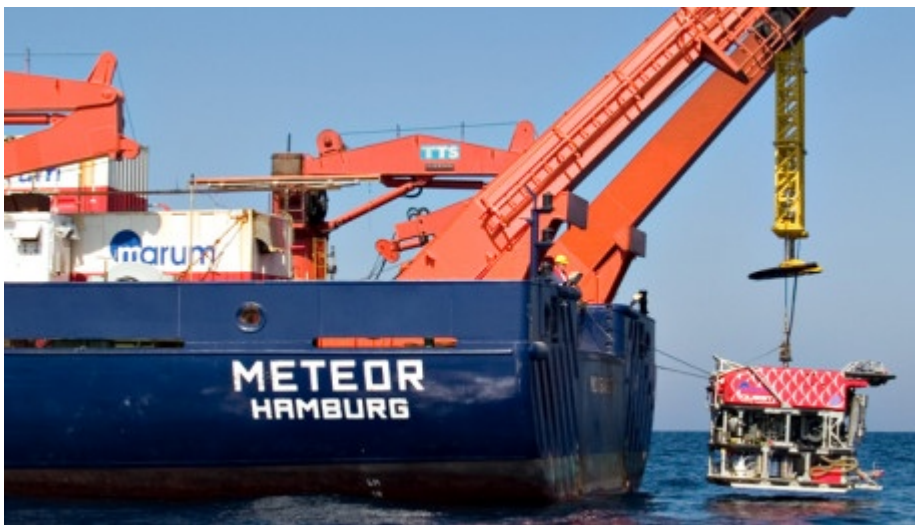
Mit einem Roboter vom Forschungsschiff Meteor wird der Meeresboden erforscht.