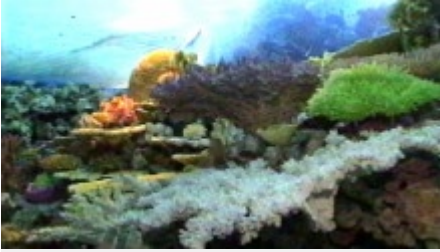
Das CO2 bedroht auch die Existenz der Korallen

Eine weitere Frage, mit der sich das Forscherteam um Frau Rhein beschäftigt, ist, was mit dem CO 2 passiert, das durch den Gasaustausch im Ozean landet. Nicht nur die Luft enthält mehr Kohlendioxid, sondern auch das Wasser. Sicher ist jedenfalls, dass dadurch das Wasser saurer wird. Eine Bedrohung für alle Schalentiere und Korallen, denn die Säure frisst den Kalk auf - also ihr Gehäuse.