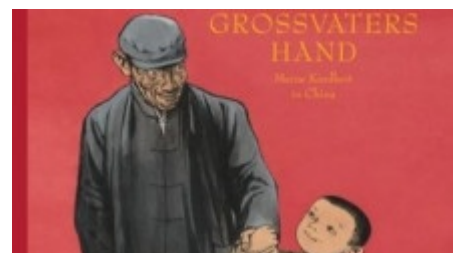
Chen Jianghong "An Großvaters Hand", Moritz Verlag im August 2009, ab vier Jahren

Der Künstler malt in diesem Buch seine persönliche Kindheitsgeschichte mit Tusche auf Reispapier. Die ergreifenden und aufwühlenden Bilder erzählen von der großen Liebe des kleinen Jungen zum Großvater und zu seiner Familie und führen Leser und Betrachter in die kommunistische Geschichte Chinas ein.