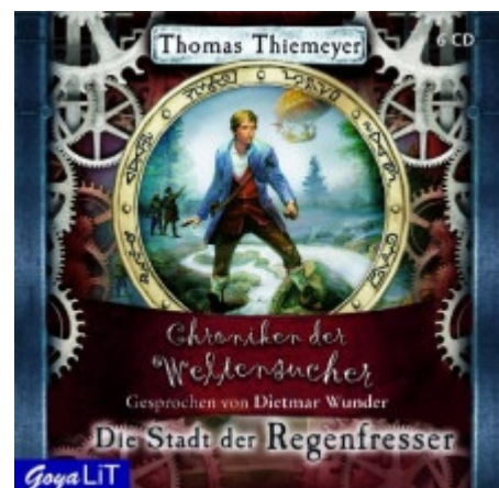
Thomas Thieme "Die Stadt der Regenfresser", Jumbo Neue Medien & Verlag im September 2009, ab zwölf Jahren

Eine fesselnde Abenteuergeschichte mit atemberaubenden Schauplätzen. Dietmar Wunders packende und spannungsgeladene Lesestimme, jagt dem Hörer so manches Mal einen Schauer über den Rücken.