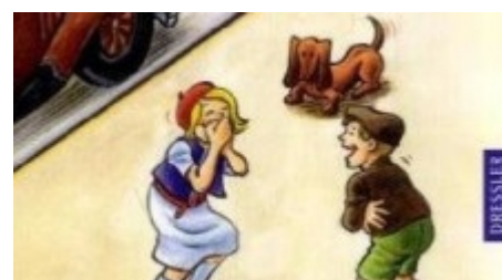
Erich Kästner und Isabel Kreitz "Pünktchen und Anton", Dressler Verlag im August 2009

Eine faszinierende Bilder-Reise durch einen Kinderbuchklassiker, der in neuer Farbigeit erstrahlt.