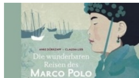
Anke Dörrzapf "Die wunderbaren Reisen des Marco Polo", Gerstenberg Verlag im Juli 2009, ab neun Jahren

Diese und viele andere Episoden und Etappen bringen großen und kleinen Lesern das Leben des frühen Weltenbummlers nahe – ergänzt durch wunderschöne Illustrationen und historische Hintergrundinformationen.