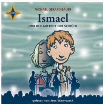
Michael Gerard Bauer "Ismael und der Auftritt der Seekühe", Hörcompany im August 2009, ab zehn Jahren