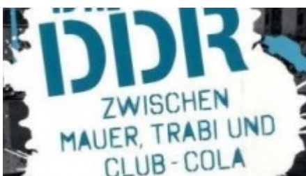
Manfred Schwarz "Die DDR - Zwischen Mauer, Trabi und Club-Cola", Oetinger Verlag im Juli 2009, ab 14 Jahren