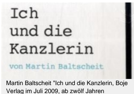
Martin Baltscheit "Ich und die Kanzlerin", Boje Verlag im Juli 2009, ab zwölf Jahren