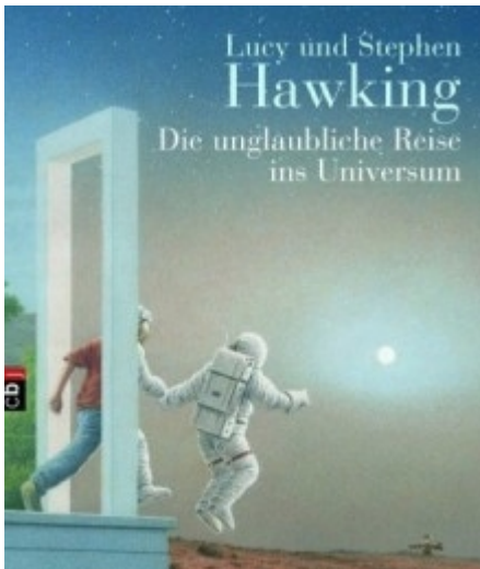
Lucy und Stephen Hawking "Die unglaubliche Reise ins Universum", dbj im September 2009, ab zehn Jahren