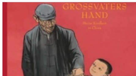
Chen Jianghong "An Großvaters Hand", Moritz Verlag im August 2009, ab vier Jahren

Der Künstler malt in diesem Buch seine persönliche Kindheitsgeschichte mit Tusche auf Reispapier. Die ergreifenden und aufwühlenden Bilder erzählen von der großen Liebe des kleinen Jungen zum Großvater und zu seiner Familie und führen Leser und Betrachter in die kommunistische Geschichte Chinas ein.