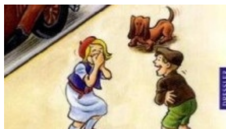
Erich Kästner und Isabel Kreitz "Pünktchen und Anton", Dressler Verlag im August 2009

Eine faszinierende Bilder-Reise durch einen Kinderbuchklassiker, der in neuer Farbigeit erstrahlt.