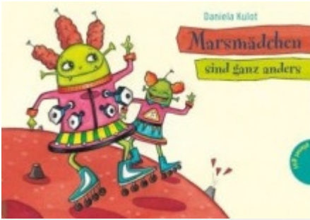
Daniel Kulot "Marsmädchen sind ganz anders", Planet Girl Verlag im Januar 2010, ab zwölf Jahren

Marsmädchen verhalten sich irgendwie seltsam: Gehen zu zweit aufs Klo, wollen sich nach einem missglückten Friseurbesuch vom Hochhaus stürzen, finden sich meist ganz schön uncool und verknallen sich ausschließlich in Traumtypen. Aber kommt uns das nicht irgendwie irdisch bekannt vor? Ein schreiend komisches Buch mit galaktisch guten Illustrationen für pubertierende Mädchen und ihren geplagten Familienanhang.