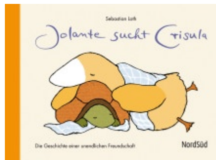
Sebastian Loth "Jolante sucht Crisula", Nord-Süd-Verlag im Februar 2010, ab vier Jahren