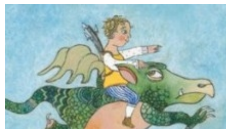
"Märchen für mutige Jungs", Boje Verlag im Februar 2010, ab acht Jahren

Mut hat viele Gesichter. In Märchen sowieso. Nicht nur die Prinzen besiegen tapfer ihre Drachen, sondern auch einfache Handwerker, Bauernbuben oder Schafhirten ziehen in die Welt hinaus und verrichten heldenhafte Taten. Doch egal welche unterschiedlichen Aufgaben sich die Burschen stellen müssen, eines ist ihnen allen gemeinsam: ihr Vertrauen auf die innere Stärke. Eine Märchenzusammenstellung aus aller Welt mit wunderschönen Illustrationen, die Jungs von ihrer starken Seite zeigen.