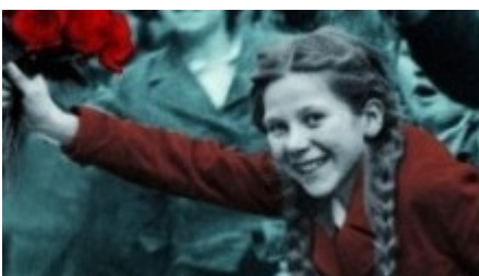
Jürgen Seidel "Blumen für den Führer", cbj im Februar 2010, ab zwölf Jahren