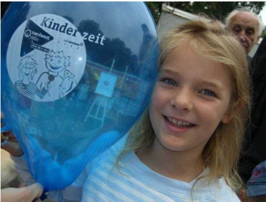
Viele von euch holten sich einen blauen Luftballon der Kinderzeit an unserem Stand im Bürgerpark ab.