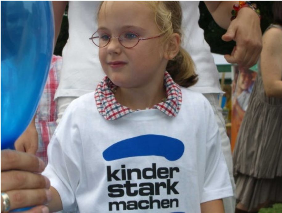
Wir sind dabei - Kinder stark machen