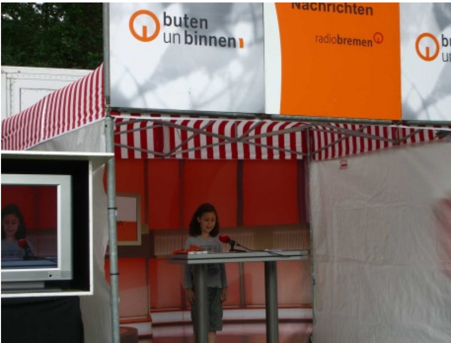
Am buten un binnen Stand konnte man sich fühlen, wie ein echter Fernsehmoderator.