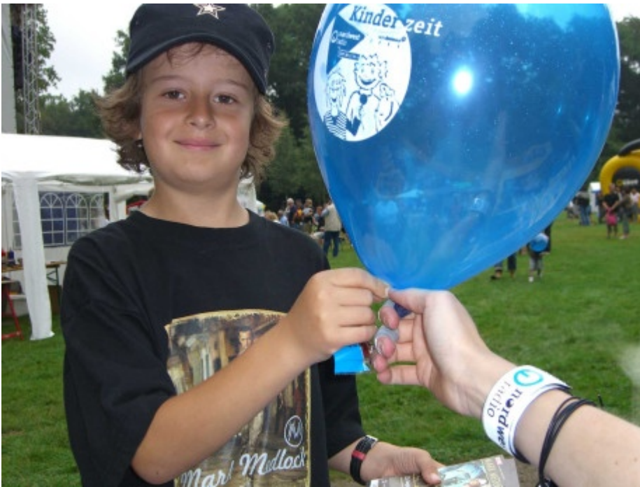
So einen blauen Luftballon der Kinderzeit gab es für jeden, der uns besucht hat.