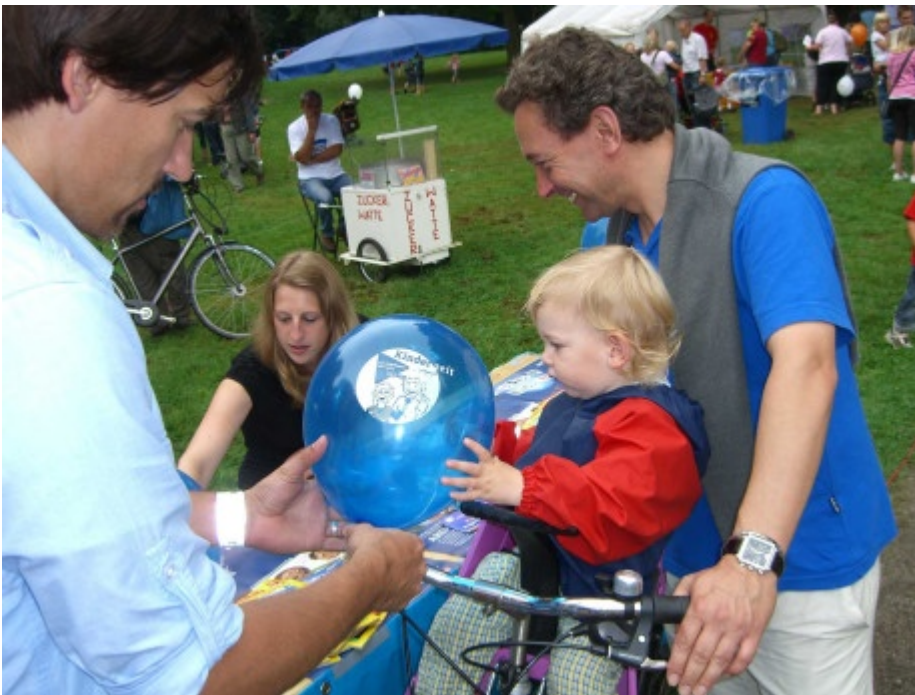
Auch die ganz kleinen fanden unsere Luftballons ganz toll.