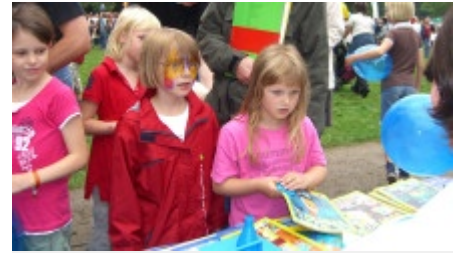
Es gab viele Dinge zu sehen und zu erleben.