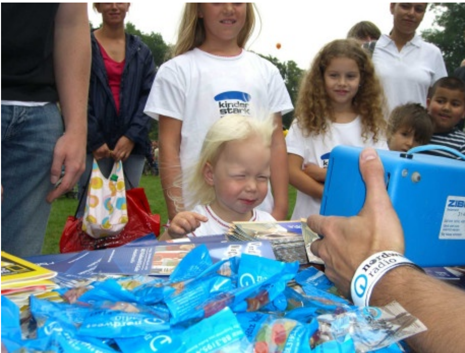
So eine Luftballon-Aufpust-Maschine macht ganz schön viel Wind.