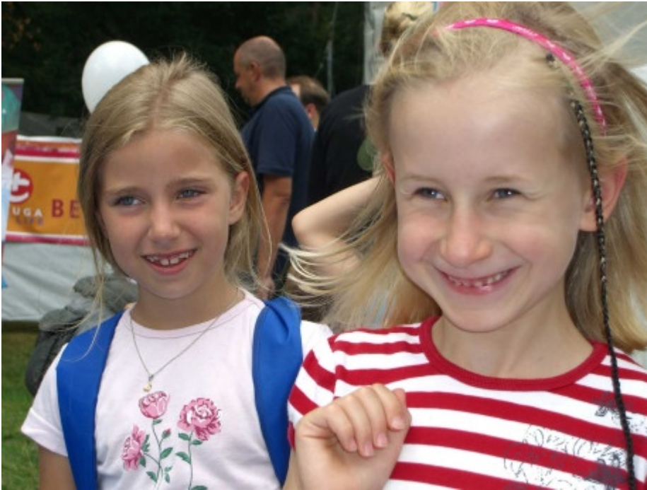
Das strahlen zwei um die Wette