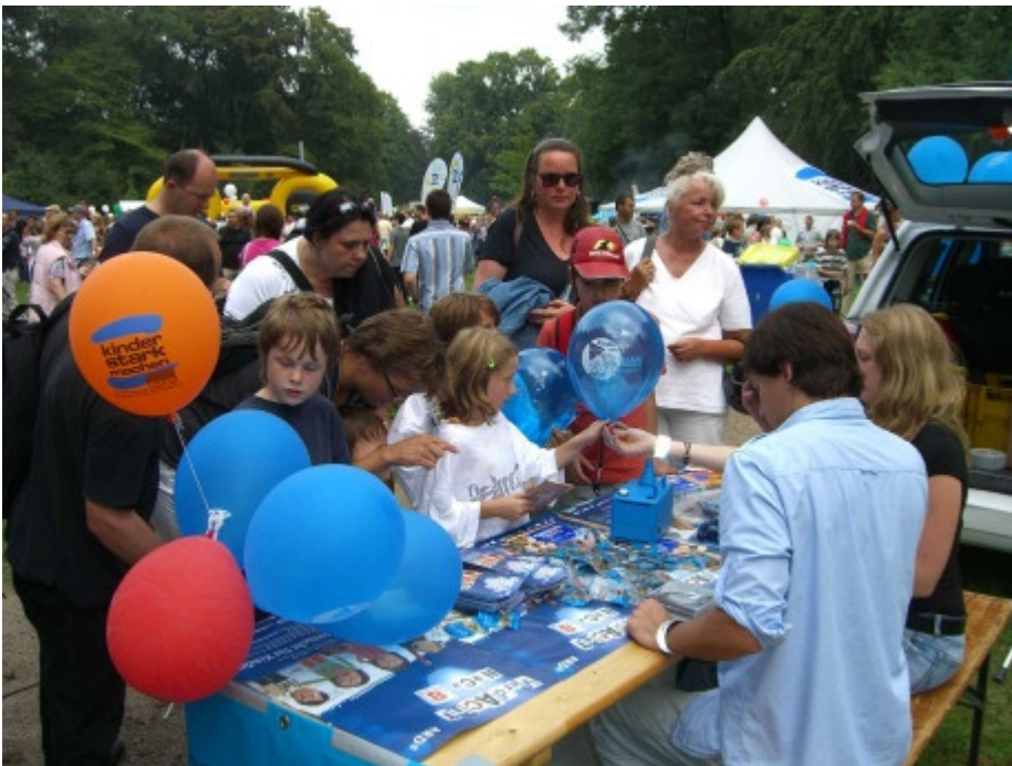
Andree hatte alle Hände voll zu tun.