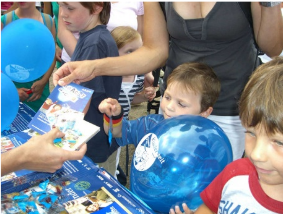
Für jeden der vorbei kam gab es eine Kleinigkeit.