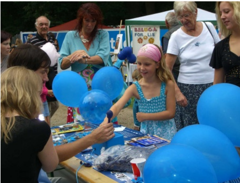
Ab und zu nahm Andree gerne eure Hilfe in Anspruch.