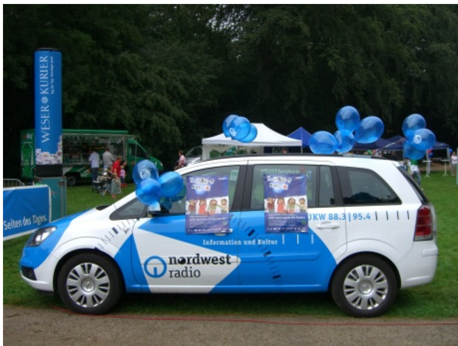
Die Kinderzeit unterwegs