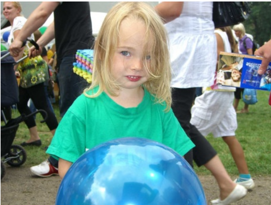
"Im nächsten Jahr wird der Unterschied zwischen dem Luftballon und mir hoffentlich nicht mehr ganz so groß sein."