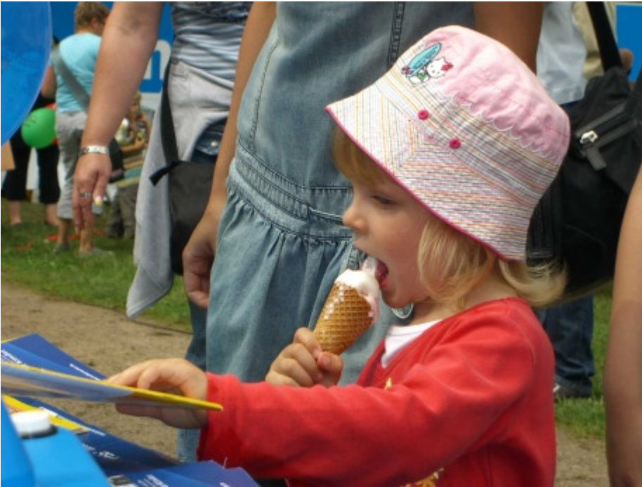
In der einen Hand ein Eis, mit der anderen wird gestöbert. Kein Problem, wie man sieht!