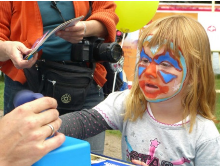
So hübsch bemalt konnte man viele Kinder laufen sehen.