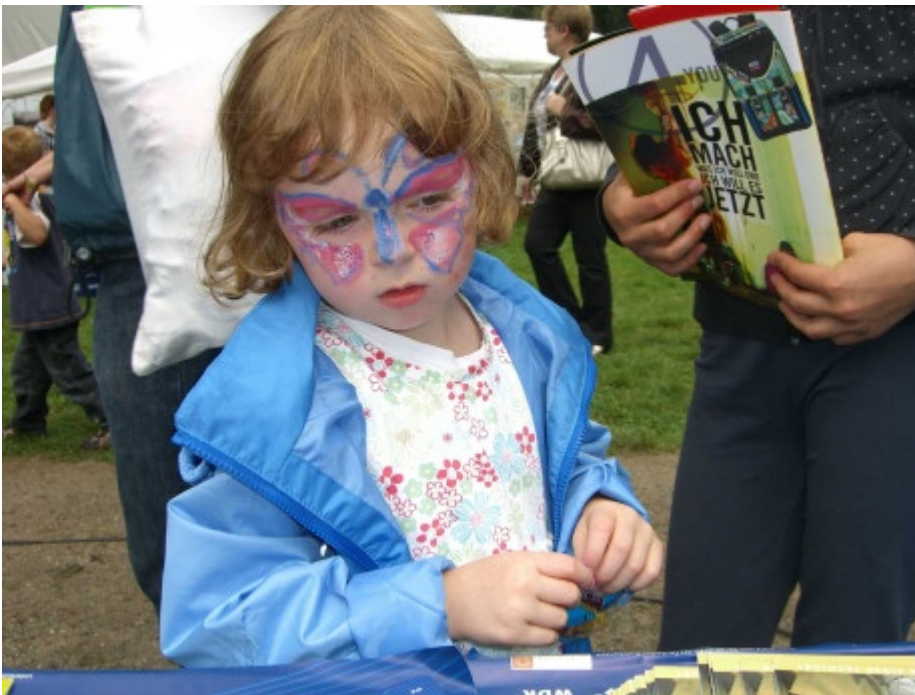
Ein kleines Schmetterlings-Mädchen