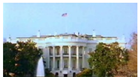
Im Weißen Haus in Washington wohnt der jeweilige Präsident von Amerika mit seiner Familie.

Barack Obama hat während seines Wahlkampfes auch Deutschland besucht. Das war im Juli 2008 und er war in unserer Hauptstadt Berlin. Er hat dort an der Siegestsäule vor 200.000 Menschen gesprochen. Obwohl er damals noch gar nicht der Präsident der Vereinigten Staaten war. Die Berliner waren begeistert von seinem Auftritt. Für einen deutschen Politiker wäre das momentan undenkbar. In dieser schwierigen Zeit brauchen die Menschen einen Präsidenten, dem sie vertrauen. Und sie haben Vertrauen in Barack Obama. Der studierte Jurist hat sich schon früh für Menschen stark gemacht, denen es nicht besonders gut geht. So hat er gleich nach seinem Amtsantritt versprochen, das Gefangenenlager Guantanamo - das es seit den Anschlägen des 11. September gibt - zu schließen. Außerdem hat er an seinem ersten Arbeitstag mit den politischen Führern von Israel und Palästina telefoniert. Zwischen den Einwohnern dieser beiden Gebiete gibt es seit langem Krieg. Eine seiner Aufgaben sieht er darin, bei der Lösung dieses Konflikts behilflich zu sein.