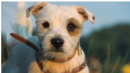
Ein treuer Gefährte