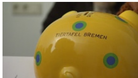
Sparschwein der Bremer Tiertafel - jeder Euro hilft.